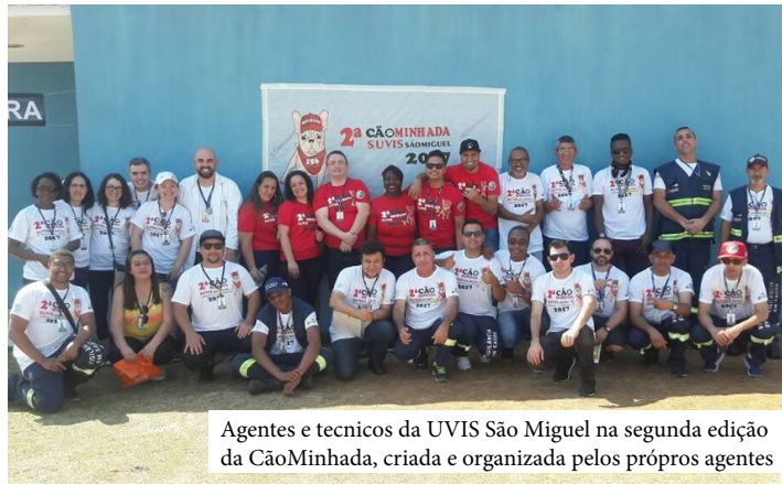
Agentes e técnicos da UVIS São Miguel na segunda edição da CãoMinhada, criada e organizada pelos próprios agentes

- Game sobre morcegos, mostrando de forma divertida e interativa, como lidar com esses nossos amiguinhos alados;