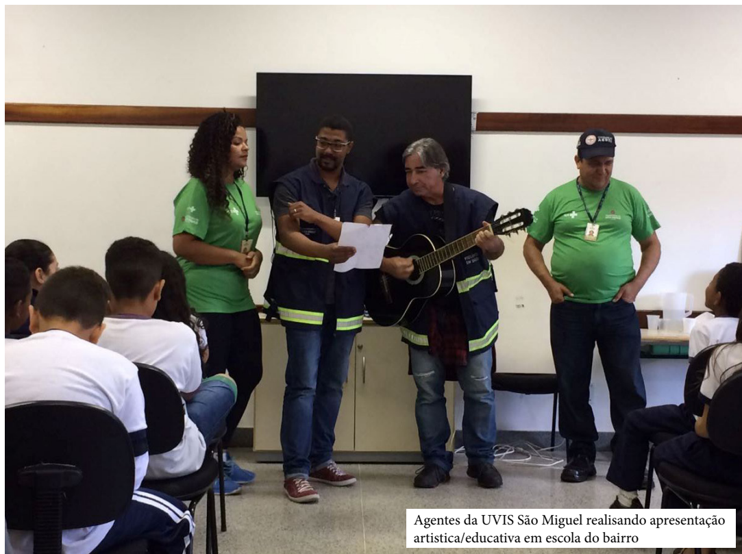
Agentes da UVIS São Miguel realizando apresentação artística/educativa em escola do bairro